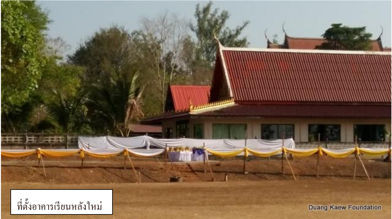
ที่ตั้งอาคารเรียนหลังใหม่