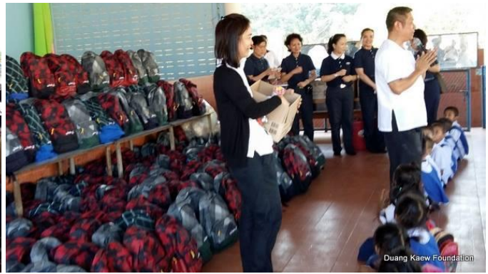
Duang Kaew Foundation