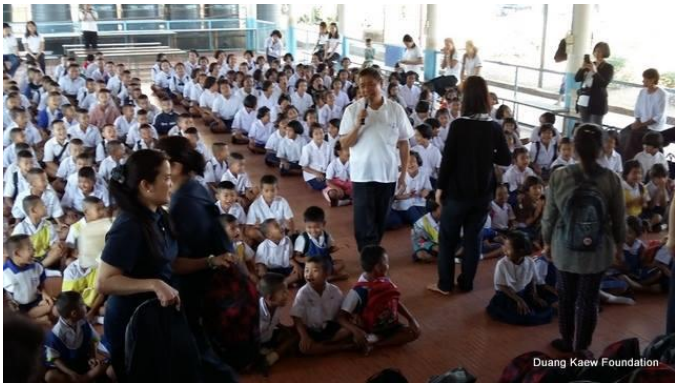
Duang Kaew Foundation