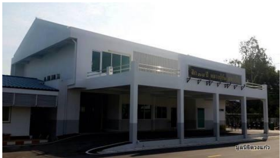
มูลนิธิดวงแก้ว