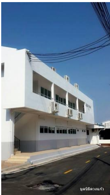
มูลนิธิดวงแก้ว