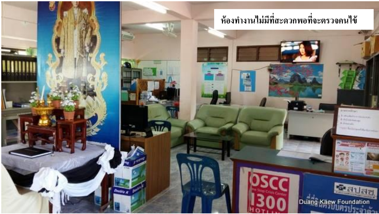
ห้องทำงานไม่มีที่สะดวกพอที่จะตรวจคนไข้