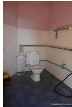
ห้องน้ำทั้งเจ้าหน้าที่ ผู้ป่วย ผู้พิการ ใช้ร่วมกันมีเพียง 2 ห้อง