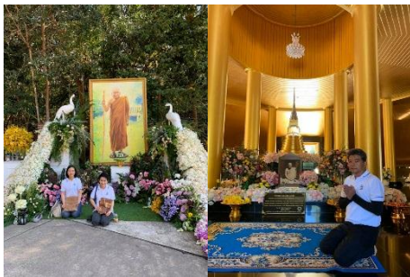
วัดหนองป่าพง กราบพ่อแม่ครูอาจารย์หลวงปู่ชา และครูบาอาจารย์สายหนองป่าพงอีกหลายท่าน ฟังธรรมจากหลวงปู่คุณ พระอาจารย์คำพอง กราบพระอาจารย์นเรศและพระอาจารย์สำอังกค์ ถวายปัจจัยไปยธรรมแก่พ่อแม่ครูอาจารย์ ก่อนจะลากลับ กทม.