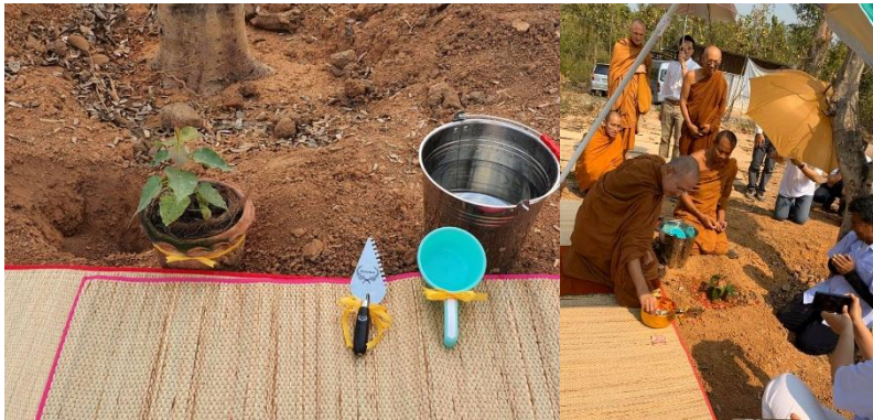
ปลูกต้นโพธิ์พุทธคยา