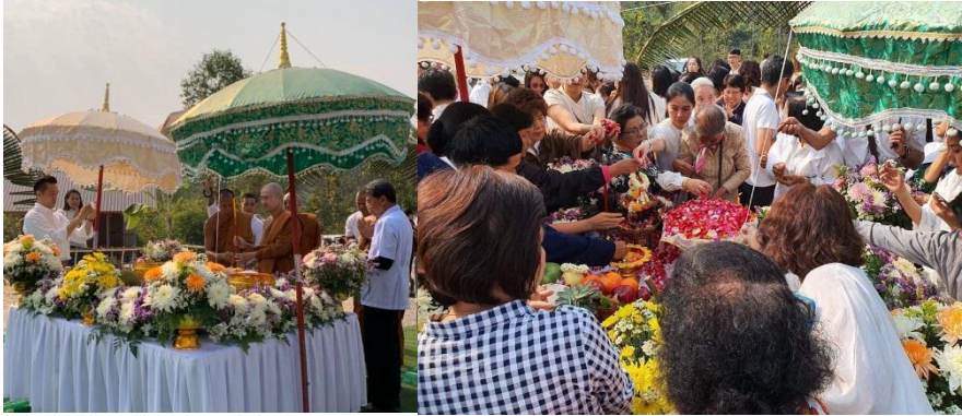
วางศิลาฤกษ์สร้าง พระธาตุมหาวัน