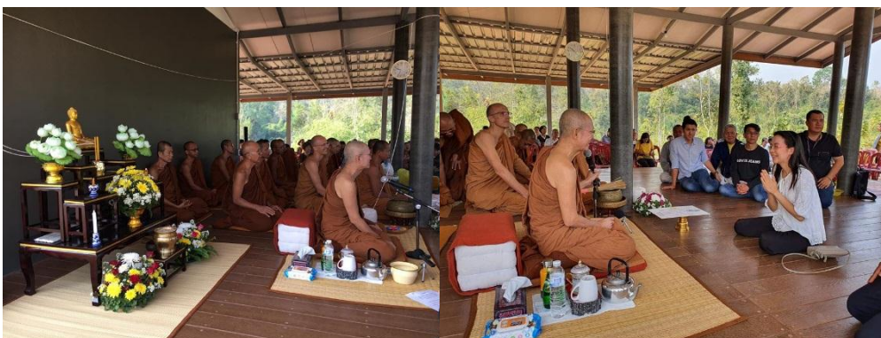
รับมอบเครื่องฟอกไต และเตียงไฟฟ้า