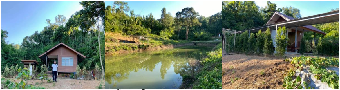
21 พ.ย. 63 รพ.หนองวัวซอ เตรียมขึ้นคานชั้นสองแล้วครับ